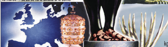
Dan. 7:24 Dinaka tse some ke dikgosi di le some tse di tla tsogang mo bogosing jo.

Ka ntsha ya khuduga ya boidiidi jwa batho (351-476AD) , Mmuso wa Roma o ne wa kgaoganngwa go nna mebuso e 10 ya Yuropa e mentye (Ela tlhoko dinaka tse 10 le menwana ya maoto e some). Dinaka tse di kgaoganeng le go sa ngaparelanteng fela jaaka go thakanya tshipi le mmopa ga menwana ya maoto e 10 go emetse go sa kgonegeng go nna le Yuropa e e kopaneng e e tla nnelang ruri.