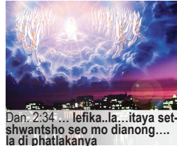
Dan. 2:34 ... lefika... itaya setshwantsho seo mo dianong... la di phatlakanya

MOPOROFETI Daniele o ne a bona gore ka nako e batho ba tla leakang go kopanya Ditshaba tsa Yuroa le nako e lefatshe le tla nngang le dipetso tse di oketsegileng le dintwa, lefika le legole lo tla itaya dinao tsa setshwantsho mme le tla se phatlakanya ka botlalo. Lefika le le emetse Go tla ga ga Jesu Keresete (Dan. 2:34-35, 44; Pesalema 18:32). Keresete O tla tla gape ka bonako mo marung a legodimo ka baengele ba Gagwe, mme O tla bonwa ke batho botlhe (Tshe. 1:7). Gore batho ba tle ba baakanyediwe tsa go rapela e, le gore ba tle ba kgone go ema mo katlholong, Modimo O tlhagisa batho ka molaetsa wa bofelo wa kutlwelebotlhoko o o fitlhelwang mo Tshenolo 14:6-12.