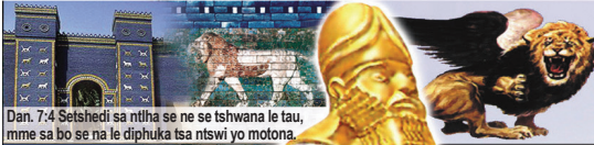
Dan. 7:4 Setshedi sa ntsha se ne se tshwana le tau, mme sa bo se na le diphuka tsa ntswi yo motona.

Tlhogo ya gouta le tau (letshwao le le tswalesegi-leng la Babilone) le emetse Mmuso wa lefatsheshe wa Babilone (608-538 BC) . Diphuka tsa ntswi yo motona di tlhalosa bofelo jo Nebukatenesare a fentseng ka jone.